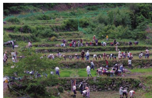
清沢塾棚田の田植え風景

田面を覆いつくした草、ブッシュ、竹を払い、崩れた石垣を修理し、沢からパイプで水を引いて、山の上方に向かって一段ずつ棚田を復元していきました。耕さないまま草の中に苗を植え、稲の成長に応じて鎌で草を刈りその根元に置いていきます。そのような田は沢蟹、イモリ、蛙(天然記念物のモリアオガ