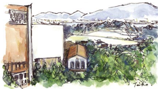
イラスト：小山禎子

わたしはぶどうの木、あなたがたはその枝である。人がわたしにつながっており、わたしもその人につながっている。ば、その人は豊かに実を結ぶ。 (ヨハネによる福音書 15章5節)