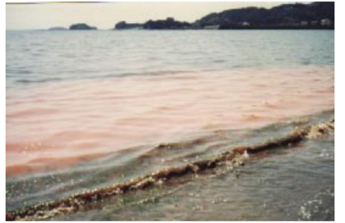
突然発生した赤潮

に関する国際会議が2010年に名古屋で開かれます。海は多種多様なプランクトンが生きています。赤潮は様々な生き物を死滅させ、一種のプランクトンのみで構成されたのち、自らも死滅し一時的に死の海にしてしまいます。生物の多様性の崩壊です。一つの生きものだけで構成される自然界の危うさを知ることが出来ます。