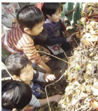
ルーテル幼稚園でのダンゴムシ探し