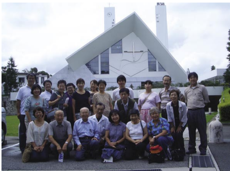
サビエル記念聖堂前

その夜、津和野・乙女峠での出来事、改宗を迫る激しい拷問とそれにも負けず最後まで信仰を貫いた切支丹たちの実話を、私たちは胸が潰れるような思いで聞きました。翌日その場所である光淋寺跡を訪