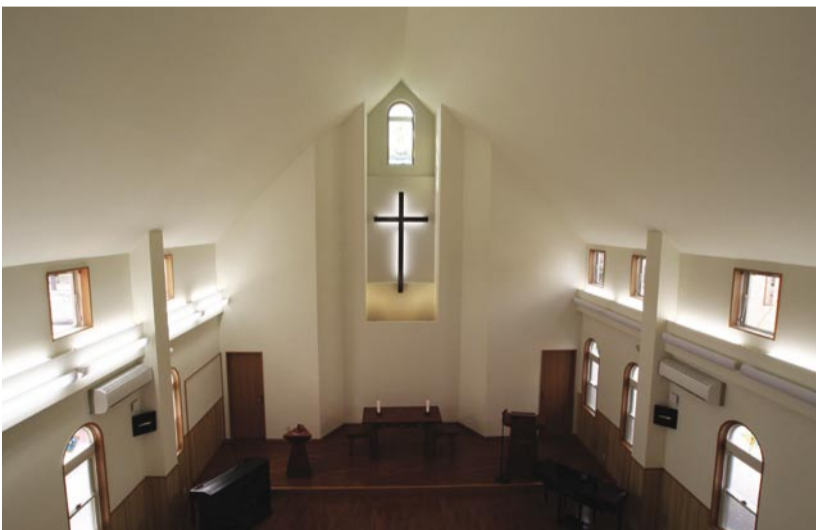
新しくなった大垣教会の会堂内

新しい会堂の中心は聖卓です。ここが主の恵みを受ける場所となり、またここが恵みを伝えるために派遣されてゆく出発点となります。それはさらに多くの人々がこの聖卓に集うことができるようになるためです。宣教のための新しい良い器と頂いたことを感謝して、主から託された務めを喜んで果たしてゆきたいと願っています。