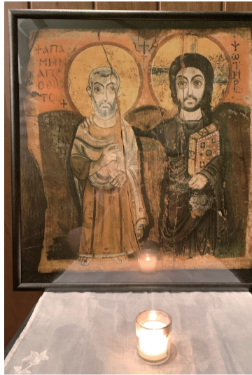
「友情のアイコン「キリストと修道院長メナ」(8世紀、ルーブル美術館所蔵)」

今年の聖霊降臨(ペンテコステ)は、どんな風が吹くのでしょうか。世界を取り巻く環境や身近なところにおいて、疫病も戦禍もなくしてほしいと願っている人は多くおられます。そのなかで、私たちは聖霊の息吹きに希望をいただいています。