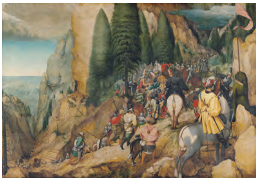
ビートル・リウゲル(文) 聖パウロの信心(1597年) ウィーン美術館蔵

「わたしは、あなたがたをみなしごにはしておかない。あなたがたのところに戻つて来る。」(ヨハネ14・18)